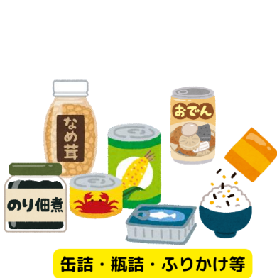
缶詰・瓶詰・ふりかけ等