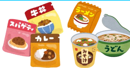
レトルト食品・インスタント食品