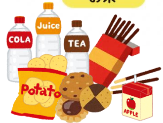
お菓子・ジュース